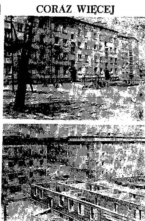
Wieloletnie prace budowlane w Częstochowie. Widać nowe budynki mieszkalne i przemysłowe.