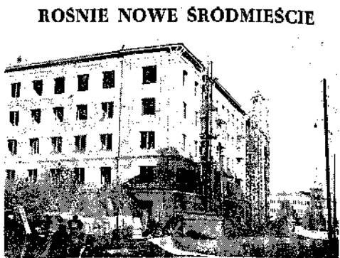
Przy ul. Rucka dobudują kółka prac przy budowie pierwszego etapu nowego osiedla śródmiejskiego. W najbliżej wybudują 70 mieszkań. Na zdjęciu: do bloku są wkrótce wprowadzają się lokatorzy.

ROSNIE NOWE ŚRODMIEŚCIE W naszym mieście, w związku z podwyższeniem cen, wzrósł koszt utrzymania mieszkań. Władze miasta powinny podjąć odpowiednie kroki, aby obniżyć koszty.