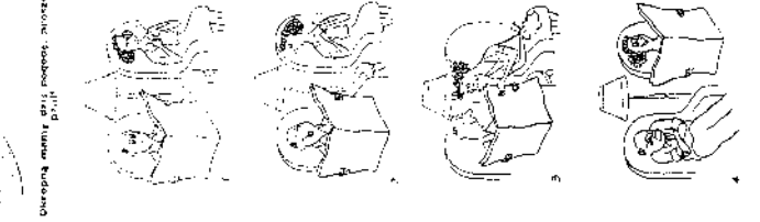
Okropną mamy dziś pogostę, zwróć uwagę!