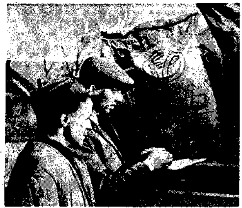
W związku z zbliżającą się kampanią wyborczą jesienią chłopcy (z dwudziestu) oraz członkowie spółdzielni produkcyjnych zaprezentowali się do nauki sztuczne, których coraz więcej dostarcza nasz przemysł. Na zdjęciu: Celnik produkcyjny spółdzielni produkcyjnej na terenie woj. krakowskiego im. „Młotów Lipcowych” w Lublińcu (pow. krakowski) kontroluje pobórny z magazynu nawozu sztucznych.

„Humanité”, omawiając sytuację strajkową, stwierdza w artykule wewnętrznym: „Historia francuskiego ruchu