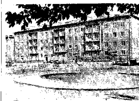
Jeden z nowych budowanych bloków mieszkalnych w dzielnicy Sobieskiego