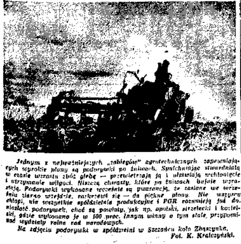
Jednym z najważniejszych zabiegów agronomicznych... Podorywki to dobre plony.