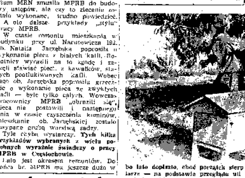
bo i tak dopłacił, choć porządek sierpnia nie jest zbyt pogodny...