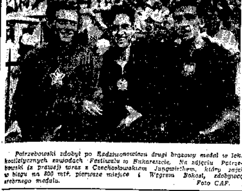
Potrzebowski zdobył po Radziehończech drugi brązowy medal to jest kolegię z wojny...