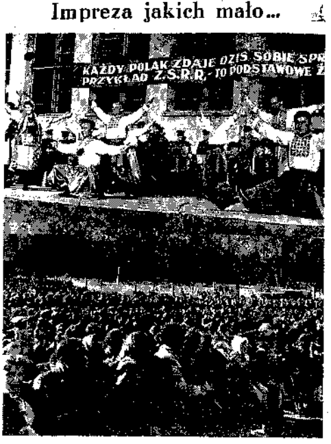
KAZDYM POLAK ZDAJE OZIS SOBIE SPÓR PRZYKŁAD Z.S.R.D. TO PODSIADKOWE Z...