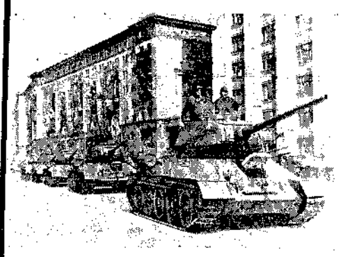
Dnia 24. II br. miało 55 rocznicę utworzenia Armii Radzieckiej. Defiladą czołgów i piechoty w Warszawie...