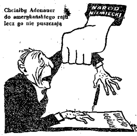
(rys. J. Witaj)

„Z procesa krakowskiego należy wywnioskować, że trzeba uczynić