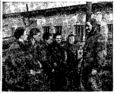
Prace przy budowie drugiej elektrowni Jaworzno II weszły obecnie w okres szczytowego naświetlenia. Rozpoczęto już uruchamianie i synchronizowanie pracy poszczególnych urządzeń elektrowni.