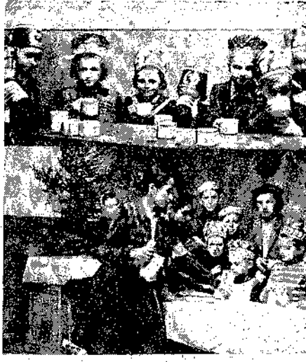
Wieloletni Nowy Rok drzew, Morgane udział w zorganizowanych dla nich przez TFD...