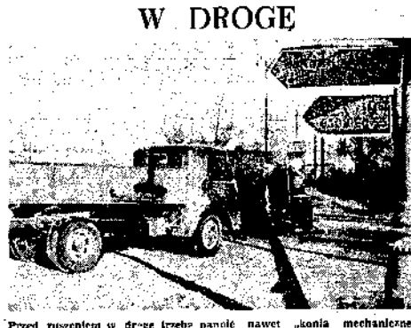
Przed ruszeniem w drogę trzeba napoleć nawet „konia mechanicznego”. Przed stacją CPN stoją długie rzędy samochodów czekające na pobranie benzyny

Podczas gdy w sklepach MHD i PSS można otrzymać tylko 3 rodzaje poziołków świątecznych w 2 kol-