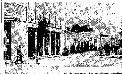
Najeklepkawymi dla rolników pawilonem wystawy jest pawilon rolnictwa, w którym poruszane są najaktualniejsze problemy duby obecnej — osiedlenie wiejskiej, uproszczona gospodarka rolna oraz sposoby najnowocześniejszej uprawy. Na słabiku obok pawilonu centralnego rolnicy mogą zobaczyć wspaniałe maszyny polskie, radzieckie i czeskiej produkcji, które wyręczają chłopca pracującego, zmniejszając jego mozolny trud.