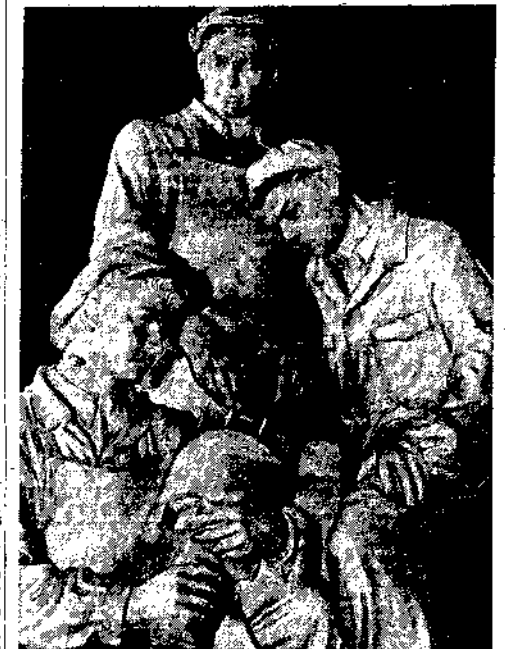
Malarsstwo, rzeźba, grafika. 74 obrazy, 35 rzeźb, 137 rysunków...