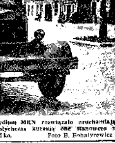
Ważny problem polewania ulic Prezydium MRN rozwiązało uruchamianiem specjalnej polewaczki. Niestety, jak dotychczas kuracja...