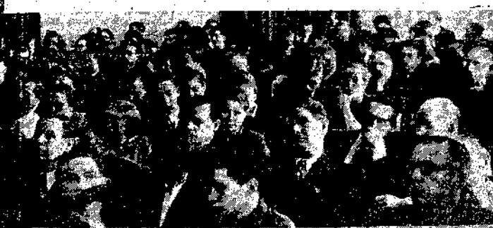
Na zdjęciu widoczny klubowe... Czytelnicy i korespondenci oceniają »Życie«

To był dzień, dla którego pisaliśmy, ci, którzy codziennie czytają naszą gazetę... Czytelnicy i korespondenci oceniają »Życie«