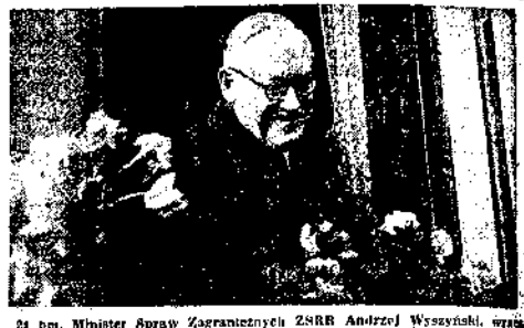
21 bm. Minister Spraw Zagranicznych ZSRB Andrzej Wyszyński, wrażliwy z Warszawy — w VI sekcji Zgromadzenia Ogólnego Narodów Zjednoczonych do Moskwy, przejechał przez Częstochowę. W czasie postoju podziurzył miasteczko z samolotu. Wyszynkiem kręciłową owarę. Na zdjęciu Min. Wyszyński w chwili przyjeżdżania do Częstochowy.

Z minuty na minutę warstwa na dywocze kolejowym w Częstochowie... (text continues)