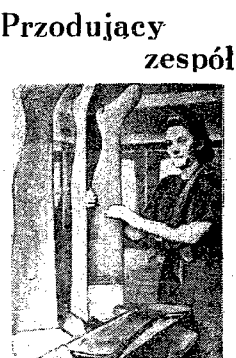
Fabryka pończoch Częstochowskich Zakładów Przemysłu Terenowego osiąga doskonałe wyniki produkcyjne...