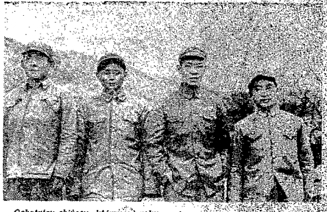
Ochotnicy chińscy, którzy do roku z górą rażą armię koreańską, walczą przeciw amerykańskiemu sukcesywnemu załamaniu, wzięli udział w walce i w walce. — Na zdjęciu czterech, wyróżnionych mediami bolszewickimi ochotników chińskich. — (Do reportażu na str. 3).