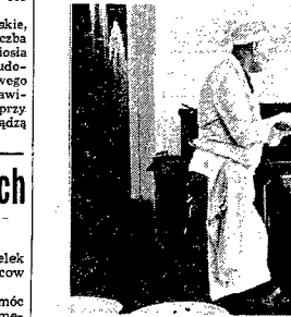
Sklep MHD z potrawy przygotowanymi w Alei, podczas wspaniałej kuchni...