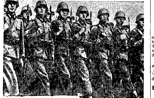
Tak maszerował na Polskę w r. 1939 Wehrmacht. Ten sam „Wehrmacht” zbiorą teraz imperialistki amerykańskie...