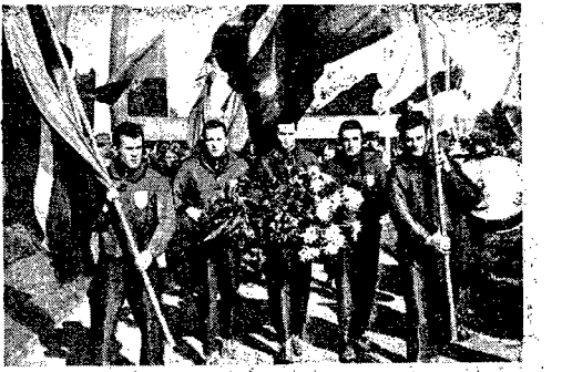
Przeszło 420 tys. dzieciąt i chłopców uczestniczyło w b. r. w całej Polsce w marszach „szlakami zwycięstw”. Młodzi warszawczanie wykładali doskonałą kondycję fizyczną i starannie przygotowanie. Niemal wszyscy uczestnicy ukończyli marsze w obowiązkowych czasach, używając tym samym normy na SPO. Na zdjęciu: składanie uścisków przez Pomnikiem Polackim Złotymy Radzieckim przy Rondzie Waszyngtona przez szafetę marszową