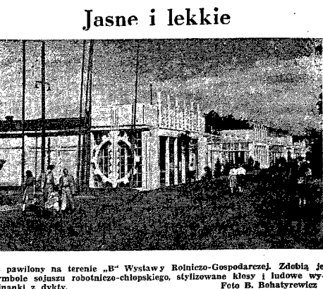
Wystawę na terenie „B“ Wystawę Rolniczo-Gospodarczą. Zdobną je symbole sojuszu robotniczo-chłopskiego, stylizowane Kłosa i Ludowa, wyćmiarki z dyktu. Foto B. Bohatyrewicz

W tym celu zostały wybrane: organizacja — na czele z. praw. Grossem, propagandowa — której przewodniczący to obaj br. K. Jurek, finansowa — pod kierownictwem Dr. Różańskiego i dekoracyjna — na czele z ob. Wagne rem.