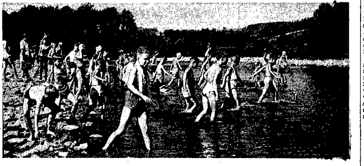
W Białym Dunajcu przebywają na kolonii letniej dzieci budowniczych Nowej Huty.

polęgające na wyzysku personelu i o-szukaniu nabywcom. Powieści te) w obawie przez potężnym trudem nie chciał wydać żadon kęlgarż. Uczynio to dopiero wydawnictwo Partii Komunistycznej.