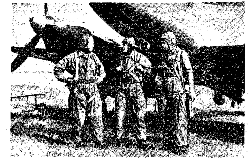
W niedzielę dn. 26 bm. na lotnisku Okecie odbyły się główne uroczystości Święta Lotnictwa. Program uroczystości pokazów lotniczych składał się z trzech części: pokazów pilotów Ligi Lotniczej, pokazów lotnictwa wojskowego i show'u spadachronowego. Tegoroczny pokaz lotniczy obejrzało około 200 tysięcy warszawiaków.

śliwskich o napędzie tłokowym, które wykonują efektywne akrobacje. Samoloty te, to słynne „Jaki” na których w drugiej wojnie światowej lotnicy I pułku myśliwskiego „Warszawskiego” boku stalowoskich sokółków - bohaterów lotników radzieckich, zwycięsko walczyli z hitlerowskimi piratami powietrznymi.