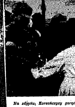
Na zdjęciu: Koreańczycy gorąco witały chińskich ochotników.

Przyjeżdżając do sprzedawcy zboża Państwo chłopów z wsiłu gromadą nadysła do Prezydenta Bieruta listy i depesze, w których wyrażają nadzieję, że w ramach Czynu noszącego Wasze imię do szeregów Zw. Wolnej Młodzieży Niemieckiej i organizacji Młodych Pionierów wstąpiło 380.583 chłopców i dziewcząt, tak że Zw. Wolnej Młodzieży Niemieckiej i organizacja Młodych Pionierów