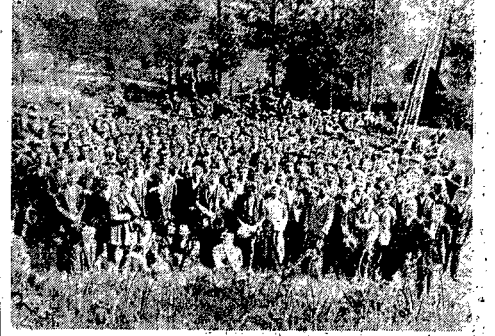
Dnia 15 sierpnia 1937 r. zaczął się strajk chłopów polskich, domagających się realizacji uchwał powziętych rok wcześniej podczas obywatelskiej manifestacji w Nowosielach. Na zdjęciu: chłopci ułani Białej przystępują do wymiaru na Przeurosk (zdjęcie z 1937 r.). — Patrz artykuł na str. 3-je.