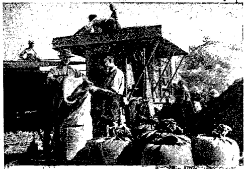
Omloty w spółdzielni produkcyjnej w Kamionce pow. Inhabrowski, woj. lubelskie, przbiegająca sprężyną. Wokół z ziarnem oprost. W młocarni... (Text continues with details about the mill and the people involved.)