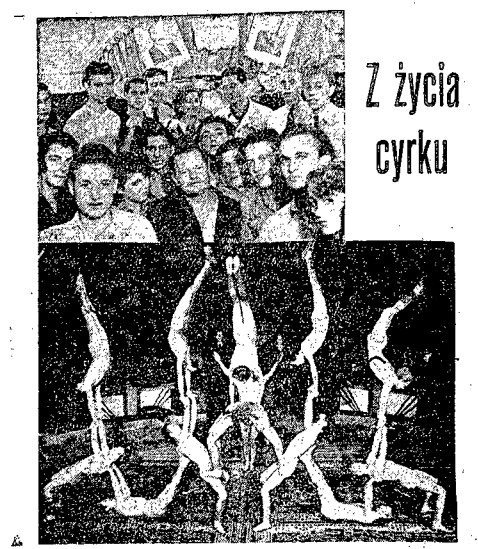
W Cyrku Państwowym Nr 7 odbyła się uroczystość wreczenia...