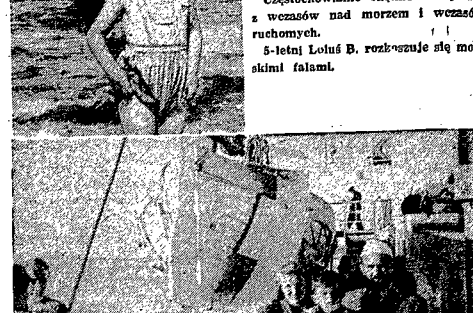
Częstochowianie chętnie korzystają z wczasów nad morzem i wozami ruchomych.