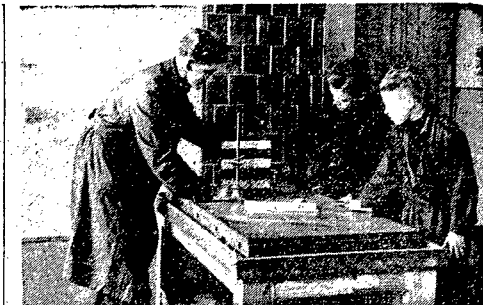
pomagają uczniom Średniej Szkoły Zawodowej w poznawaniu (takim) nauki. Na zdjęciu lekcja trasowana na przyrządzie.