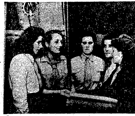
Przez współzawodnictwo pracy młodzież polska przyspiesza realizację planów gospodarczych. Młode robotnice Zakładów Przemysłu Doleńskim w Łodzi... (Caption text continues describing the group and their role in the economy.)