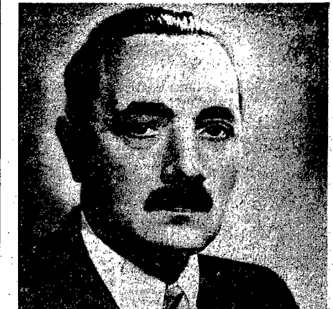
Cztery lata temu Sejm Ustawodawczy RP wybrał Bolesława Bierut, na Prezydenta Polski Ludowej.

Wybór ten dokonany został zgodnie z wolą całego narodu, dla którego Bolesław Bierut jest ucieleśnieniem najsłabszych dążeń i ideałów. Prezydent Bolesław Bierut od najwcześniejszych lat życia związany z polskim rewolucyjnym ruchem robotniczym przewodził i przewodził walce tożsamej przez polską klasę robotniczą i jej czelowy oddział — Partię. Nie było donioślejszego wydarzenia, nie było osiągnięcia większej miary, w które Prezydent Bolesław Bierut nie wniósłby wkładu swej myśli, woli i działania. Swą niezmordowaną ofiarną pracą dla dobra ogółu, nawiązał bliski kontakt z ludnością i serdecznie bezpośrednim stosunkiem do ludzi pracy. Prezydent Bierut zdobył sobie powszechny szacunek i sympatię całego społeczeństwa. Dziś Polska pod jego kierownictwem kroczy do socjalizmu i wnosi wkład w walkę o pokój, której toczy światowy obóz antyimperialistyczny pod przewodnictwem Związku Radzieckiego.