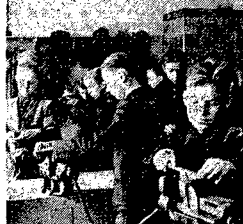
W szkole zawodowej przy ul. Garnoarskiej uczniowie uczą się zawodów rzemieślniczych, U dołu - praca w warsztacie, gdzie uczniowie wykonują młoki ślusarskie, u góry - lekcja trasowania młotki pod czujnym okiem instruktora.