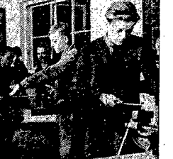
W szkole zawodowej przy ul. Garnoarskiej uczniowie uczą się zawodów rzemieślniczych, U dołu - praca w warsztacie, gdzie uczniowie wykonują młoki ślusarskie, u góry - lekcja trasowania młotki pod czujnym okiem instruktora.