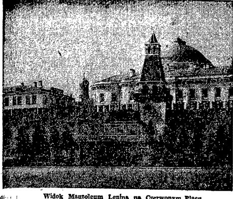
Widok Mauzoleum Lenina na Czerwonym Placu

Michail Isakowicz Przetłum. LEOPOLD LEWIN