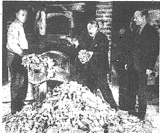
Na lewo: Znajdzona łożorości rodu Churchillów mr. Randolph „młodszy” podczas pobytu w USA. — Na prawo: 2 miliony funtów wędruje do pieca