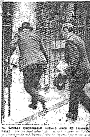
Mac Donald przerażony funtem

wysokiej sumie), które mu ojciec dał na podróż po Stanach Zjednoczonych. Mac Donald, ówczesny premier angielski, o spadku funta dowiedział się zapewne najpóźniej ze wszystkich Anglików i co sił, jak to widzimy na zdjęciu popędził na Downing Street 10, gdzie jak słusznie przypuszczał, leżała główna przyczyna upadku funta. Nie wiele się omólił. W tym czasie Mr. Winston Churchill (któremu sumienie wobec wspomnień z wojny światowej nieraz mu dokuczało), przyjmował u siebie światowej sławy blazna żydowskiego Charlie Chaplina. Tak samo jak i godny ojca synalek, z całym spokojem prowadził „W. C.” konwersację z Mr. Charlie Chaplinem, zabrał go nawet na swój jacht. — Córka Churchilla, która miała właśnie w tym czasie zostać małarką, zachciała kariery filmowej i do dziś dnia nie wie co wybrać, czy zostać kieszka małarką czy marną artystką filmową. Wybiera pomiędzy jednym a drugim. Zdziesiątna w 31 roku przyjaźń pomiędzy Chaplinem a Churchillem, właściwe owoce wydała dopiero obecnie. Chaplin nakreślił w Hollywood film zawierający tendencje antyniemieckie. — Film ten był przeznaczony specjalnie dla Anglii. Lecz los chciał inaczej. W czasie transportu przez Atlantyk okręt, którym wieszono „cenny film” został zbombardowany przez niemiecki samolot i londyńscy „kniharze” muszą obecnie czekać na kopie. Czy nadejdzie ona w właściwym terminie — trudno przewidzieć.