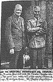
Spotkanie Chaplina z Churchillem

Żydzi podstawą kariery Churchilla — Ręka w ręce z Rotszyldami — 2 miliony funtów szterlingów poszły do pieca Charlie Chaplin w Chartwell Manor, (Westerham hr. Kentu) — „Zły los” nie chce dopuścić do Europy szowinistycznego filmu z Charlie Chaplinem