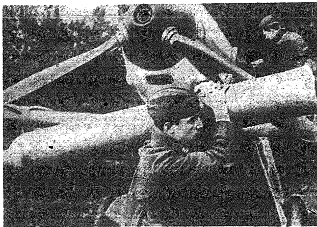
Gdy lotnik wyrusza na lot na wielkich wysokościach, musi zabrać ze sobą odpowiedni zapas tienu. Na zdjęciu naszym widzimy, jak żołnierz obsługi lotniczej niszczy butelkę z tlenem, która jest podobna do wielkiego pociągu armatniego.

W nocy z 25 na 26 marca b. r. liczne samoloty nieprzyjacielskie nadleciały na północne i zachodnie dzielnice Niemiec. Przy tej sposobności w wielu wypadkach, w czasie wlotów i odlotów naruszono tereny ewerenne duńskie, holenderskie, belgijskie i luksemburskie.