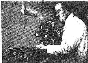
Aparat do wykrywania fałszywych banknotów.