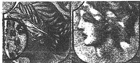
Różnice w rysunku między banknotem prawdziwym a fałszywym po powiększeniu.

Innymi oznakami odróżniającymi banknoty fałszywe od prawdziwych jest częstość nitki i niewyraźny druk, oraz odmienny odcień farby . Banknoty dolarowe są jak wiadomo jednobarwne. Mianowicie t. zw. awers, czyli strona przednia banknotu wykonana jest w kolorze czarnym, zaś strona odwrotna, czyli rewers, w kolorze zielonym. Na każdym bankno-