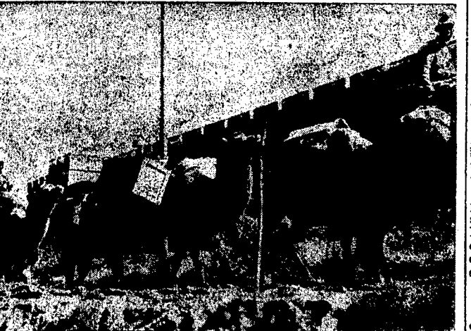
Na froncie wojny chińsko-japońskiej. Reprodukujemy oryginalne zdjęcie, związane z akcją wojenną chińsko-japońską, a mianowicie karawane wielbłądów, użytych do transportu broni i innego materiału wojennego dla Japończyków, co zostało zastosowane wskutek słabej sieci dróg żelaznych.