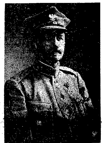
S. p. gen. Józef Dowbór-Muśnicki.

kilka lat. Zmarł w wieku 70 lat. Zmarł w majątku swym Batorowo, w pow. poznańskim, zmarł nagle na udar serca generał Józef Dowbór-Muśnicki, przeżywszy