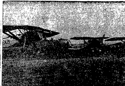
Piękny dar ziemi Nowogródzkiej dla armii.