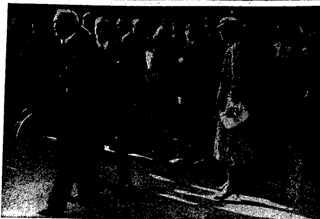
Estoński minister spraw zagranicznych w Warszawie. Przybył do Warszawy z oficjalną wizytą minister spraw zagranicznych Estonii Fryderyk Akel w towarzystwie małżonki oraz dyrektora departamentu min. spraw zagr. Estonii P. Kaasika. — Zdjęcie nasze przedstawia min. Fryderyka Akela opuszczającego dworzec warszawski po uroczystym powitaniu.

Salamanka. — Komunikat urzędowy głównej kwatery wojsk powstańczych: W Asturii na odcinku wschodnim przełamaliśmy wczoraj opór nieprzyjaciela pod Torrellana, zadając mu ciężkie straty i zmuszając go do tak szybkiego odwrotu, iż pozostawił na placu wielu zabitych i rannych, których wojska nasze zbierają. Zajęliśmy wszystkie miejscowości sąsiadujące z portem lotniczym Llanes. W dniu dzisiejszym posuwanie się naszych wojsk odbywało się nadal w kierunku zachodnim. Zajęliśmy miasto Llanes, a w chwili redagowania komunikatu, osiągnęliśmy linię Parres. W strefie południowej wojska nasze oczyściły znaczną część zajętego obszaru. Wzięto do niewoli około 500 milicjantów. Na odcinku zachodnim zanotowano tylko strzelaninę i kanonadę. Na odcinku Leon wywiad dokonany na drodze Portilla Vega de Liedana, pozwolił nam ustalić łączność pomiędzy