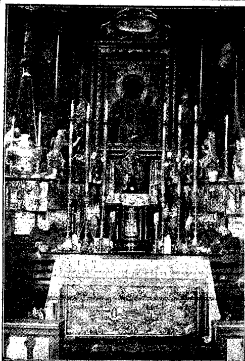
KAPLICA MATKI BOSKIEJ.

Pierwsze światło jesienne ku czci Bo- ja długie i uciążliwe nieraz wędrówki garodnicy — to uroczystość Narodzenia Najświętszej Maryi Panny, obchodzona przez Kościół katolicki, aczkolwiek dziś już nie oficjalnie, dnia 8-go września. Powstało to światło już w V wieku w Matce swej Serdecznej powierzyć wszystkie swe troski i bóle. Jak rok rocznie, tak i obecnie Jasna Góra rozbrzmiewać będzie modlitewny mi hymny, a pod strop niebios w uroczystym dniu Narodzenia Najśw. Maryi Pan- ny popłynie z serc ludu wiernego ślubowanie: „Oto służyć chcemy Bogu i Tobie, Panno Święta, która przez swą służbę, przez swój ból i ofiarę dla nas stałaś się Matką i Panią naszą”. Naród polski wie i pamięta, że Ona to,