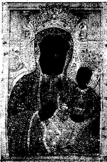
CUDOWNY OBRAZ M. B. CZĘSTOCHOWSKIEJ.