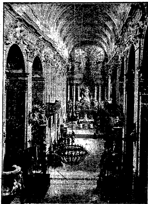
WNĘTRZE BAZYLIKI JASNOGÓRSKIEJ.