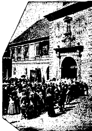
WEJŚCIE DO KLASZTORU.