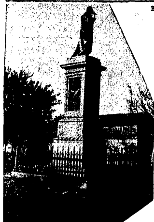
POMNIK KS. KOBDECKIEGO.