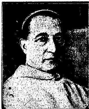
O. PIUS PRZEZDZIĘCKI, General Zakonu OO. Paulinów.