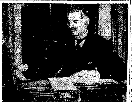
Onegdaj przedstawia Neville'a Chamberlain'a podczas końcowych prac nad budżetem.

Onegdaj po południu został przedstawiony angielskiej Izbie gmin szósty z rzędu budżet opracowany przez kanclerza skarbu: Neville'a Chamberlain'a, który za miesiąc po uroczystościach koronacyjnych zostanie premierem Wielkiej Brytanii. Na miejsce premiera Baldwin'a. Budżet Wielkiej Brytanii zamyka się po stronie dochodów i wydatków kwotą 850 milionów funtów szterlingów czyli przeszło 22 miliardów złotych. Dla całkowitego zrównoważenia budżetu Neville Chamberlain podwyższył o 3 pęny od 1 funta dochodu. Dzieci