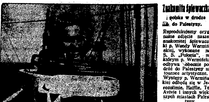
Znakomita śpiewaczka i polska w drodze do Palestyny.