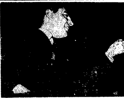
Decydujące zwycięstwo premiera Van Zeelanda nad Leonem Degrellem.

Niedzielne uzupełniające wybory parlamentarne w Brukseli, które były jednocześnie generalną próbą sił między obozem rexiwów a partiami republikańsko-demokratycznymi, zakończyły się całkowitym zwycięstwem premiera Van Zeelanda, który został wybrany, zdobywając 276.816 głosów (75,89 proc.) podczas gdy wódz rexiwów Leon Degrelle zdobył 69.342 głosów (19,05 proc.). Wynik wyborów wywołał duże wrażenie nie tylko w Belgii, ale i w całej Europie, oczekującej z napięciem rozwoju wypadków politycznych w Belgii. Rexiści zdobyli o 5.000 głosów mniej, niż przy wyborach w roku ubiegłym. Na zdjęciu z lewej strony premier Van Zeeland. Na zdjęciu oboj = Leon Degrelle.