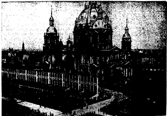
„Święto pracy” w Niemczech. W manifestacyjny sposób obchodzono w Berlinie „święto pracy”. Jako otwarcie sezonu robót publicznych. Na zdjęciu — uroczystość przed katedrą.