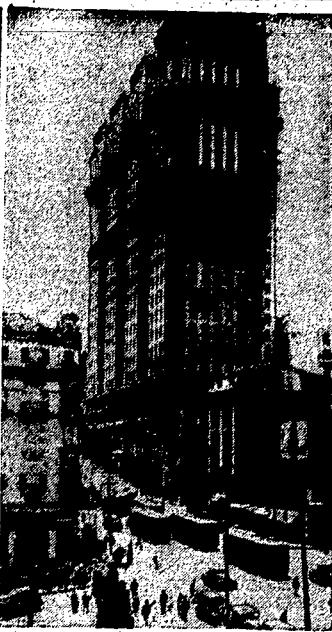
1.000 mieszkań w jednym gmachu. Zdjęcie nasze przedstawia jeden z monumentalnych drapaczy chmur w Brazylii, a mianowicie t. zw. „gmach Martinelli“ w Sao Paulo, mieszczący 1.000 lokali mieszkalnych wielopokojowych.

Przyczyną konfliktu było wysunięcie przez organizację C. N. T. żądania wycofania policji i oddziałów szturmowych. Komuniści i republikanie lewicowi domagali się początkowo rozbrojenia anarchistów, lecz zrezygnowali z tego żądania, ponieważ przekonali się, że może ono spowodować wybuch zbrojnych starć z anarchistami.