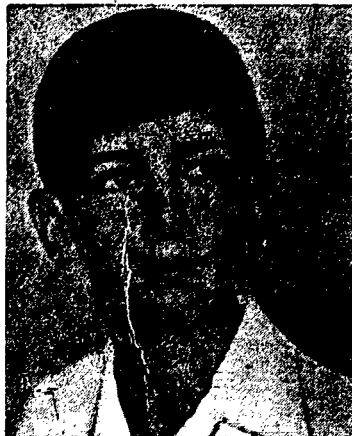
Król i regent Jugosławii.

W takiej sytuacji w wielu kołach jugosłowiańskich jako najlepsze wyjście poczyną być traktowane przeciwstawienie Włochom Niemiec, a to przez dopuszczenie tych ostatnich do Austrii. Powstałoby wtedy — jak to powiadają w Belgradzie — okres naturalnej rywalizacji między Berlinem i Rzymem, który Jugosławia wykorzystałaby dla wzmocnienia własnej pozycji międzynarodowej.