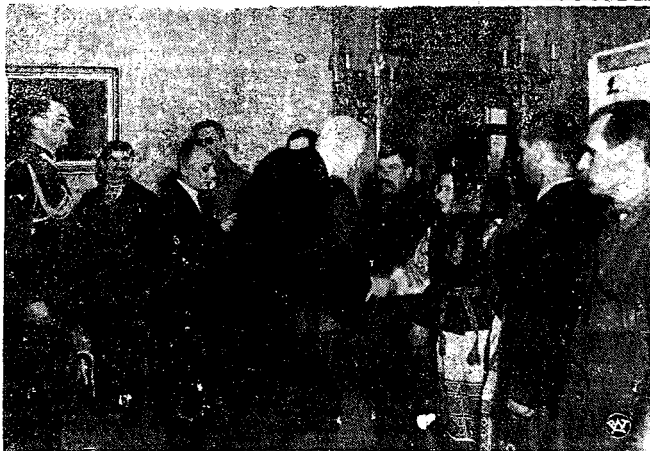
Mili goście na Zamku.

Asmara. — Na froncie Tigre, na ziemiach okupowanych, władze włoskie organizują służbę bezpieczeństwa z pomocą karabinierów, których placówki utworzono w Adui, Aksum, Entiscie, Makalle, Haussie i Adigracie.