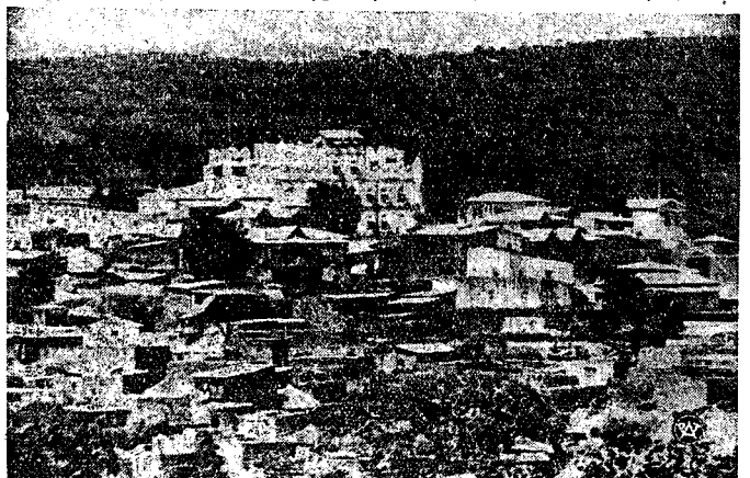
MIASTO HARRAR, jeden z najbliższych celów ofensywy włoskiej.

W końcu, w związku z oszczędzaniem węgla, praca w biurach ma zasadniczo pozostać ograniczona do czasu między godziną 8 rano a 18-ty w ciągu zimy możliwe oszczędzać na opale, względnie zużyciu prądu elektrycznego.