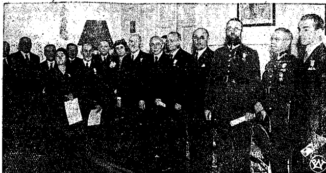
Decoracja odznaką P. C. K.

Prasa francuska podkreśla pauzę w rokowaniach o zakończenie wojny w Afryce i milczenie w tej sprawie ministerstwa spr. zagr. Dzienniki próbują natomiast wy-