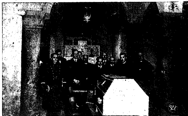
Członkowie nowego gabinetu złożyli hołd Marszałkowi Piłsudskiemu.