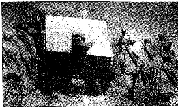
Z pola walki w Abisynji.

Havas donosi z Addis Abeby, że część armii Ras Seyuma przeszła przez rzekę Takkazę. Wojska Ras Kassy nawiązały styczność z wojskami Ras Seyuma. Podobno w niedługim czasie ma się rozpocząć kontratak celem zdobycia miasta świętego Aksum.