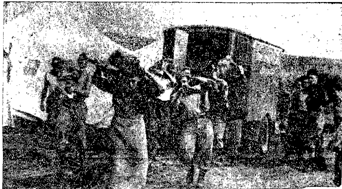
W ABISYNIJ. — Transport mięsa dla oddziałów włoskich na froncie północnym.

Na całej więc linii zbudowane są w pewnych odległościach budynki stacyjne, mieszczące po 2 i 3 dozorców, nie mających innych styczności ze światem, jak tylko ową linję telegraficzną, której strzedz muszą pilnie dniem i nocą. A ponieważ najczęściej się zdarza, że dwaj z nich zajęci są naprawą linii, zdaleka od stacji, zwykle