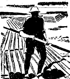
OPERA ZE STUDIA WE ŚRODĘ 17. VII. O GODZ. 21.00