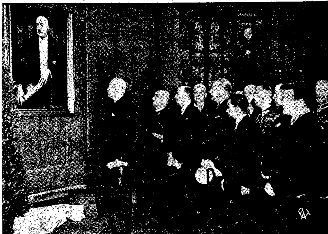
Odsłonięcie portretu pierwszego Prezydenta w Zachęcie.

W Wilnie kandydować będzie wspólnie ordynacji wyborczej do Sejmu poseł Podoski.