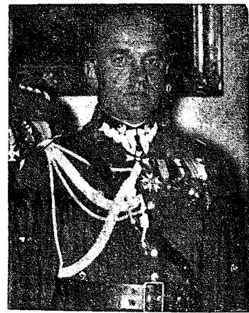
Nowomianowany minister spraw wojskowych gen. Tadeusz Zbigniew Kaprzycki.

Z zagranicy napływają już liczne kondolencje od szefów państw. M. in. przyszła wzruszająca depeza od p. prezydenta Rzeczypospolitej Francuskiej Lebrun'a. Nadeszła też kondolencja od kanclerza Hitlera. Minister Laval, bawiący obecnie w Moskwie w powrotnej drodze do Paryża zatrzyma się ponownie w Warszawie, aby złożyć hołd u trumny Marszałka. Na pogrzeb spodziewany jest przyjazd delegacji obcych rządów.