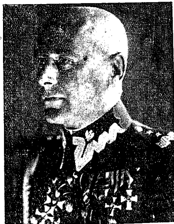
Nowomianowany gen. insp. sił zbrojnych gen. Edward Rydz-Śmigły.

Bramy Belwederu zostały zamknięte i wejście dla wszystkich osób wzbronione. Nad pałacem powiewa wielka czarna choroągiew, opuszczona do połowy masztu.