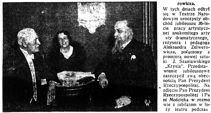
Jubileusz Al. Zelwerowicza.

W tych dniach odbył się w Teatrze Narodowym uroczysty obchód jubileuszu 35-lecia pracy artystycznej znakomitego artysty dramatycznego, reżysera i pedagoga Aleksandra Zelwerowicza, połączony z premierą nowej sztuki J. Szaniawskiego „Krysią”. Przedstawienie jubileuszowe zaszczylił swą obecnością Pan Prezydent Rzeczypospolitej. Na zdjęciu Pan Prezydent Rzeczypospolitej i Pani Mościcka w rozmowie z jubilatem w loży teatru podczas przerwy.