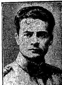
Napoleon Północnej Ameryki.

Według doniesień prasy niemieckiej, w Niemczech skupia się wszystkich byłych członków dawnych niemieckich organizacji morskich w „National-socialistischer Marinembund”, który postawił sobie za zadanie propagować ideę kolonialną i zorganizować wszystkich byłych marynarzy. Organizacja ma charakter militarystyczny.