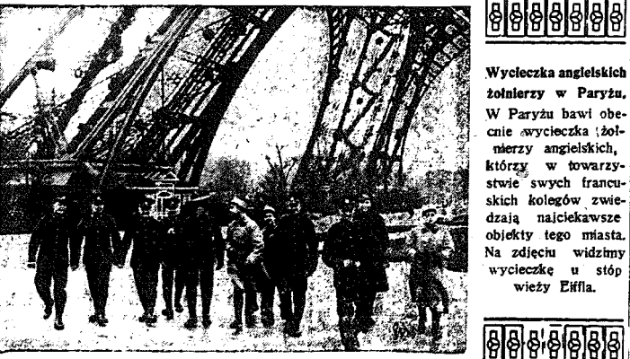
Wycieczka angielskich żołnierzy w Paryżu. W Paryżu bawi obecnie wycieczka żołnierzy angielskich, którzy w towarzystwie swych francuskich kolegów zwiedzają najciekawsze objekty tego miasta. Na zdjęciu widzimy wycieczkę u stóp wieży Eiffa.

O ile berlińska wizyta Simona nie dojdzie do skutku, uda się Simon przez Kopenhagę do Warszawy i Moskwy.